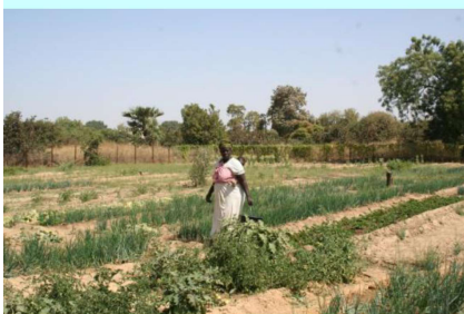
Le périmètre maraîcher de Fangouné Bambara