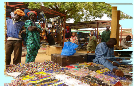
Le marché du jeudi à Diéma

La production est consommée pour partie dans les villages. Le surplus est vendu à Diéma Ville au marché du jeudi matin . Ce marché a été entièrement financé et refait avec l'aide de Chilly Mazarin et du Ministère des affaires étrangères Français. Cela a permis de développer un confort et une hygiène importants pour les habitants et pour les commerçants et de multiplier le nombre d'étals.