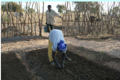
Préparation du périmètre maraîcher à Sirakoro