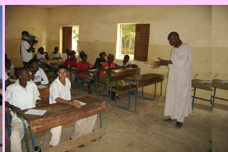
Second cycle de Diéma