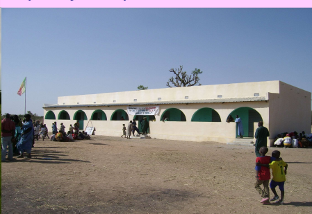
École de Kudungula

Le comité des jumelages de Chilly Mazarin a pris toute sa part dans la réalisation de ces écoles. Avec la construction du lycée de Diéma par l'État Malien, la scolarisation est maintenant possible à Diéma du jardin d'enfants jusqu'au lycée . Cet atout est toutefois contrarié par l'augmentation de la démographie scolaire, le faible accroissement des capacités d'accueil et le système des doubles vacances. Autres obstacles à une bonne scolarisation, les faibles ressources des familles, le peu de moyens de l'enseignement public, l'absence de lycées techniques dans la région, la concurrence des cultures saisonnières et des travaux domestiques. Au delà de la construction d'écoles, Chilly finance des fournitures pour les élèves en opérant avec la mairie de Diéma, une répartition la plus juste possible entre les écoles.