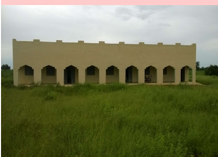
École de Sourenghédou