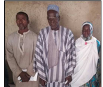
Lambangoumbo (de G à D) : conseiller villageois, chef de village, présidente association villageoise