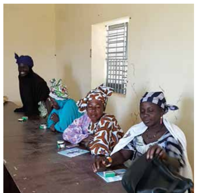
Marachères en stage au Centre de Formation Professionnelle de Nioro.