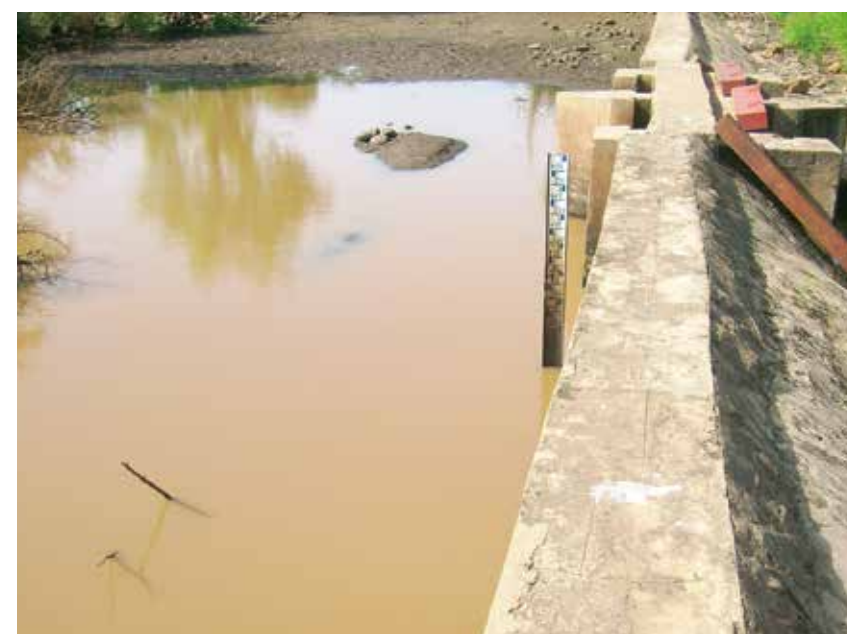
Barrage du village.