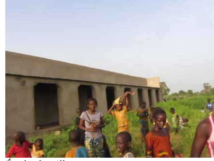
École du village.