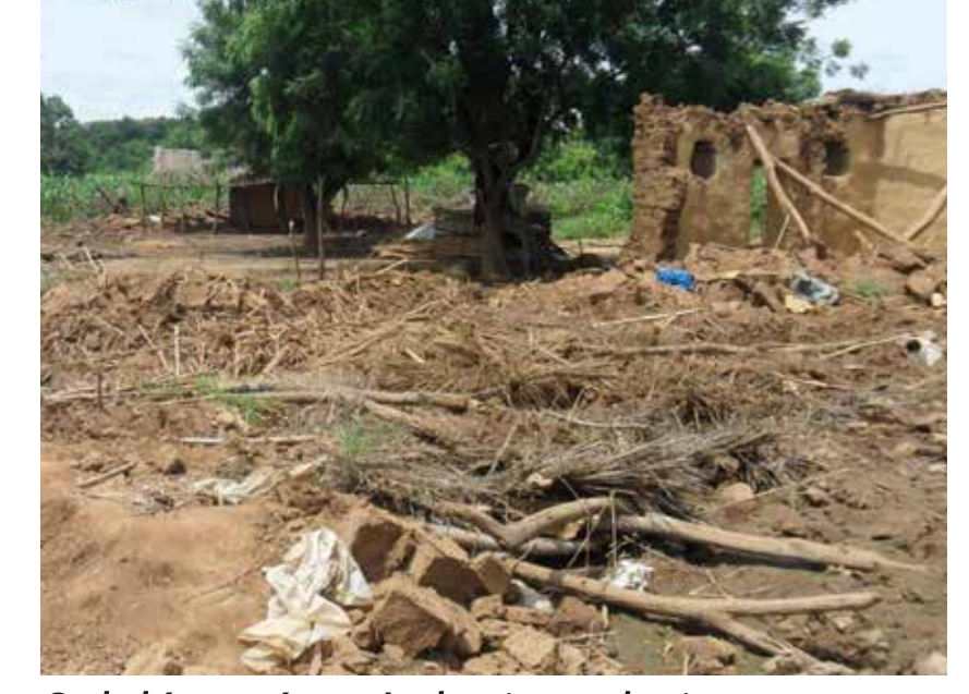
Sol dévasté après les inondations.