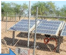
Forage FP4 PRS En panne