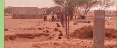
Réalisation de la clôture en grillage et haie vive