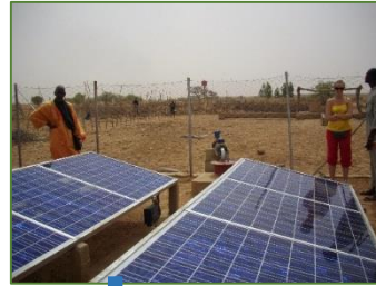
Forage NF 2009 nouvelle pompe