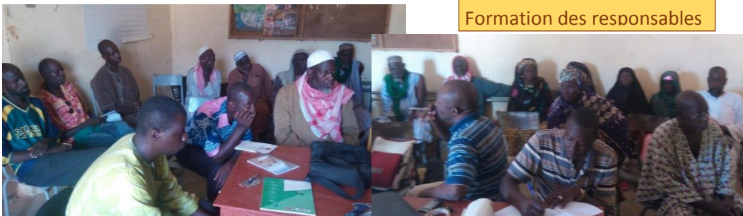
Formation des responsables