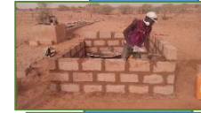
4 bassins de puisage en béton de 5 m 3 chacun