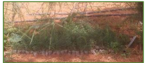
Pépinière pour haie