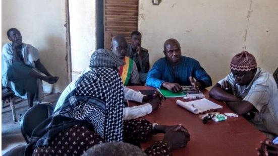
Lancement des travaux : 25 mai 2015