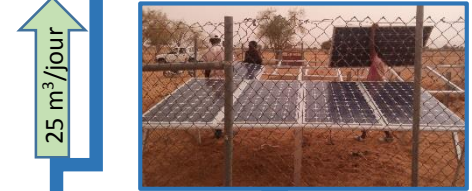
Forage FP4 PRS nouvelle pompe nouveau champ solaire