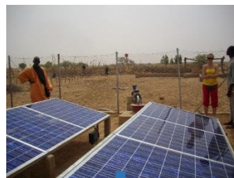
Nouveau forage NF 2009