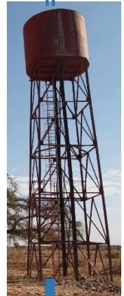
Distribution vers village