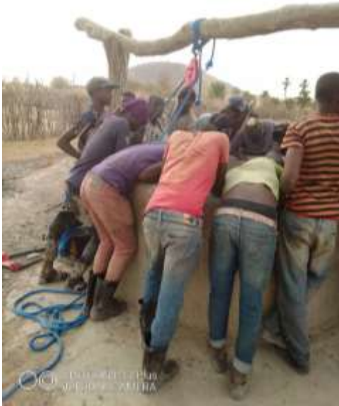
L'équipe de Sécouréni devant un des puits