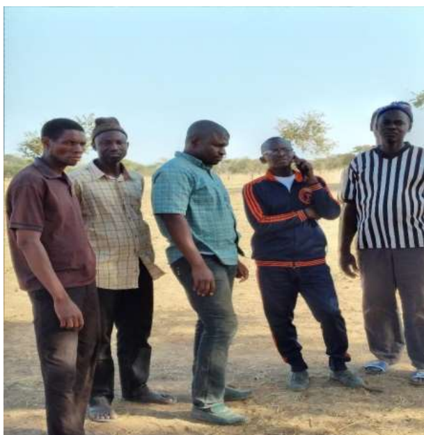
Echange sur le site de Secouréba