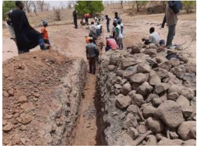
Les fouilles de la digue de Medina