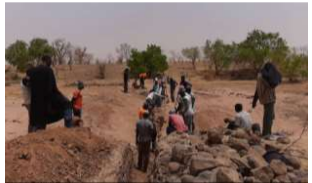
L'équipe de Madina

A partir du 13 avril, Les travaux ont démarré en simultanément sur le barrage de Secouréba, les digues de Secouréni et Madina et les puits de Secouréni