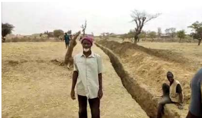
Les fouilles du barrage de Sécouréba

A partir du 13 avril, Les travaux ont démarré en simultanément sur le barrage de Secouréba, les digues de Secouréni et Madina et les puits de Secouréni