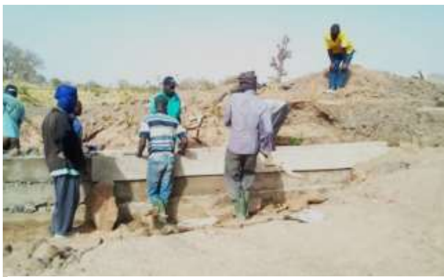
Les travaux préparatoires de renforcement de la digue de Sécouréni