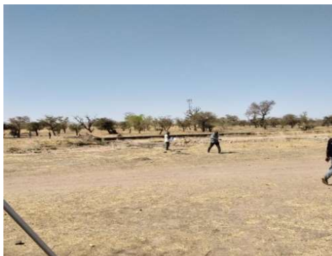
Site digue Secouréni