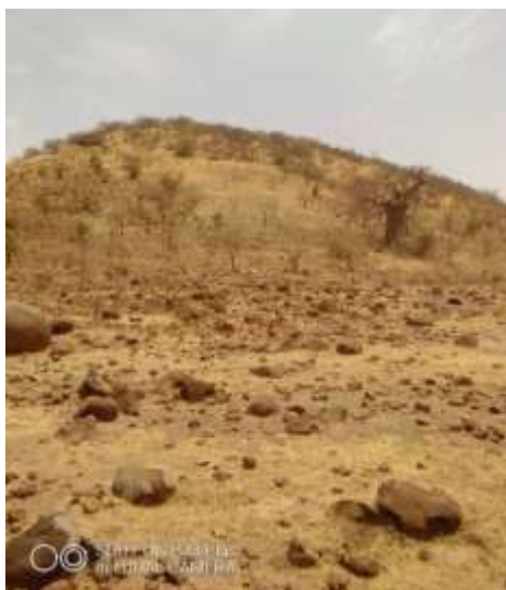
La zone d'approvisionnement des matériaux ( colline qui domine Sécouréni de 300 m