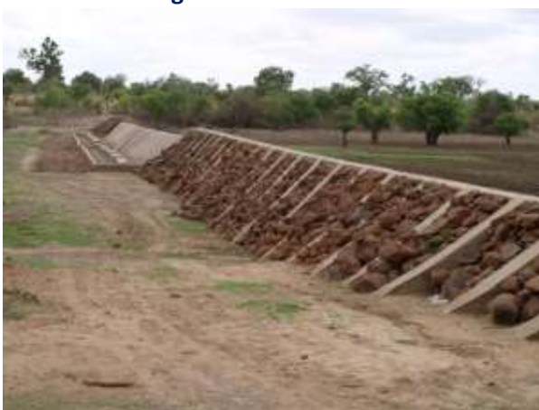
Exemple de micro-barrage : Diabé en fin de construction