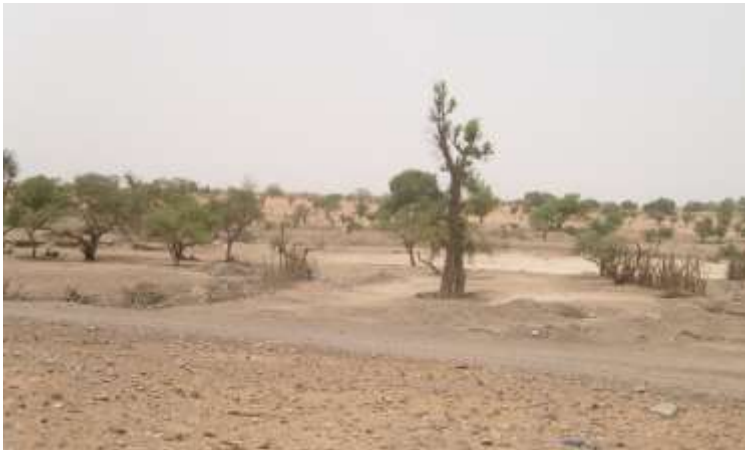
Le site du barrage de Sécouréba

Photos : Modibo Traoré – Soma Coulibaly - ADESMA, traduction Mamadou Coulibaly