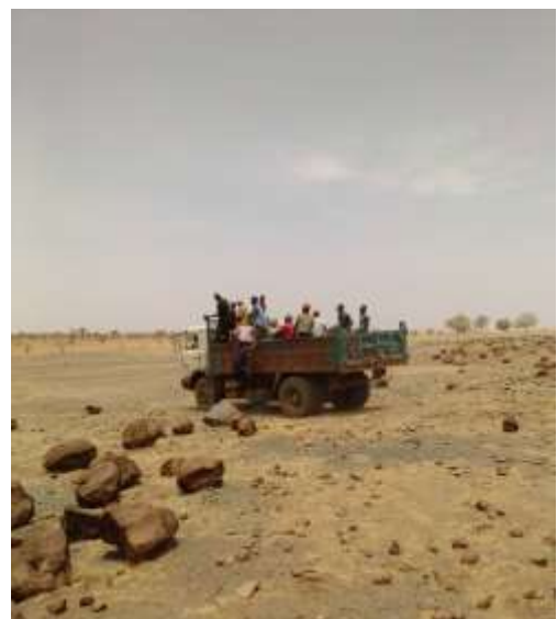
La benne de transport des matériaux