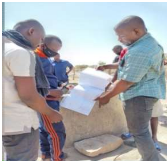
Autour du 2eme puits de Secouréni