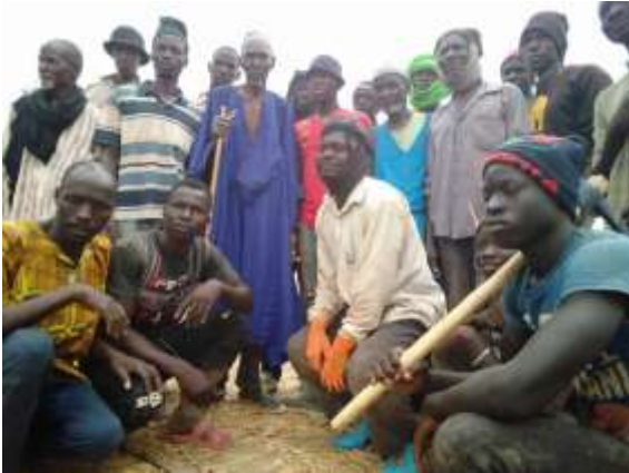
L'équipe de Secouréni avec le chef de village

Dans chacun des villages, des groupes de jeunes se sont organisés en équipes de travail pour effectuer les travaux à haute intensité de main d'œuvre (THIMO).