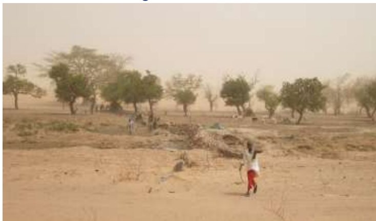
Le site de la digue de Sécouréni