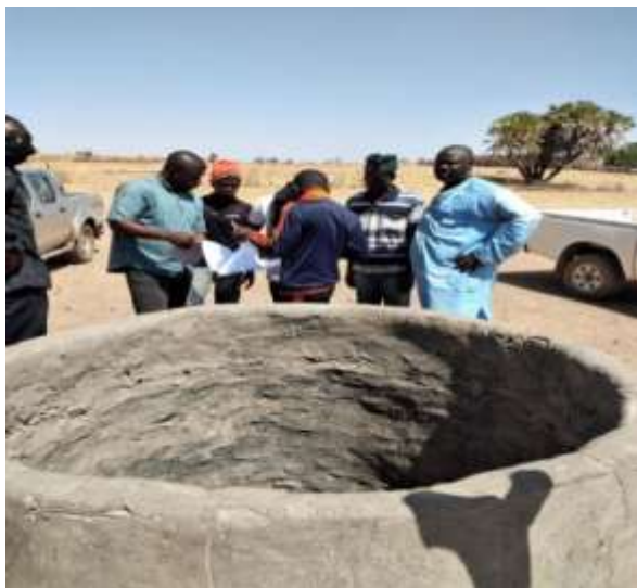
Autour du 1 er puits de Secouréni

L'équipe de topographie de l'entreprise a procédé à des mesures des sites prévus pour le barrage et les digues. Quant aux puits à réhabiliter, ils ont été visités par toute l'équipe.