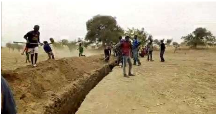
L'équipe de Secouréba

Dans chacun des villages, des groupes de jeunes se sont organisés en équipes de travail pour effectuer les travaux à haute intensité de main d'œuvre (THIMO).