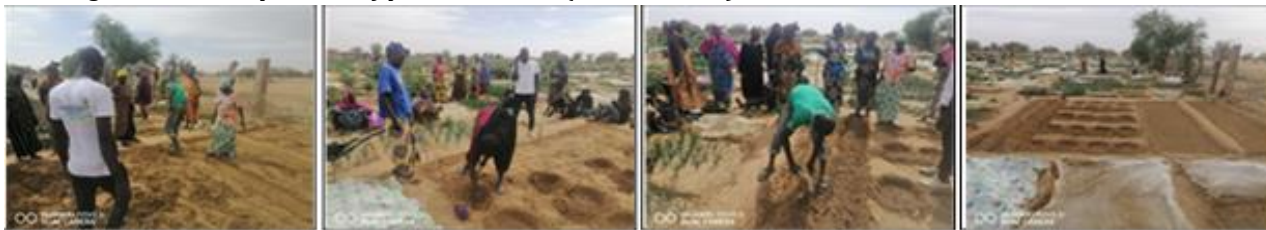
Aménagement d'une parcelle type à Hassi (Koréra-Koré).