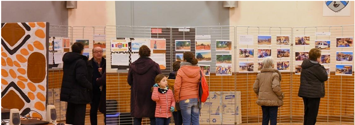
L'exposition permettait aux visiteurs d'appréhender la vie des habitants de Lakamané