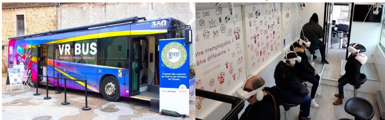
Un moment de vision virtuelle sur 360° totalement bluffant

Le 1 er février 2024, la médiathèque a fait venir dans la cour de la ferme le bus de réalité virtuelle qui présentait les marionnettes traditionnelles du Mali. Ce spectacle gratuit a été vu par une dizaine d'adultes et une cinquantaine d'enfants. Les adultes comme les enfants étaient très attentifs et avides de réponses à leurs questions auprès du responsable de la présentation aussi bien sur le Mali que sur les marionnettes ou la technique de réalité virtuelle.